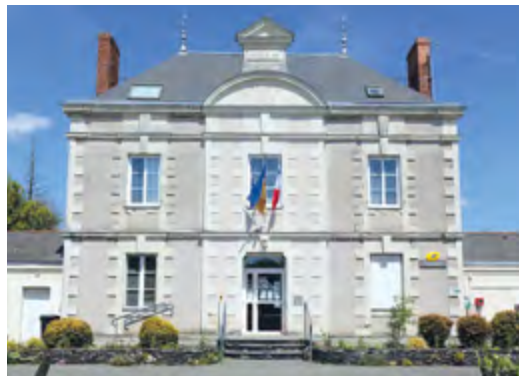
La mairie aujourd'hui