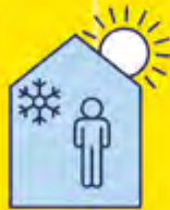
RESTEZ AU FRAIS