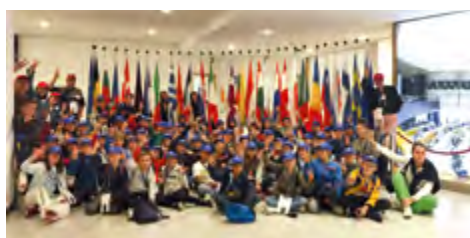
Les enfants de l'école Jeanne d'arc en visite au parlement européen à Bruxelles.