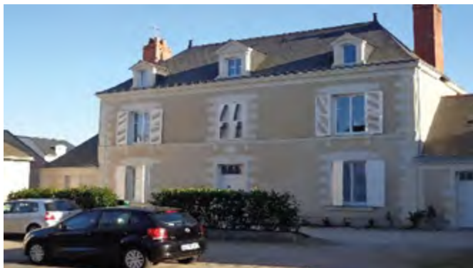
La Mairie de 1847, au 18, rue Nationale