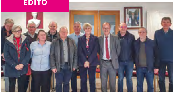
Visite du sénateur Stéphane Piednoir, venu à la rencontre des élus de la commune.

Photo de couverture : le Château à motte se prépare à vous accueillir et vous a concocté un programme riche en événements.