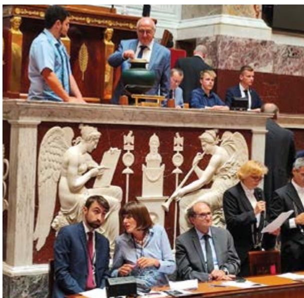
François Gernigon, nouveau député, lors du vote pour l'élection de la Présidente de l'Assemblée nationale.