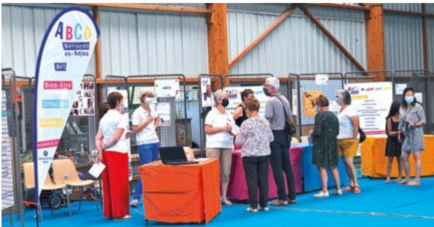
Venez à la rencontre des associations pour trouver vos futures activités.

Cette année, il aura lieu samedi 3 septembre, salle des Joutes. Rendez-vous de 9h à 12h pour trouver quelle(s) activité(s) vous allez pratiquer tout au long de la saison prochaine.