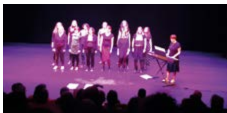
La chorale Chœur de meufs