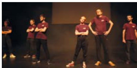
Impro avec la troupe La pieuvre