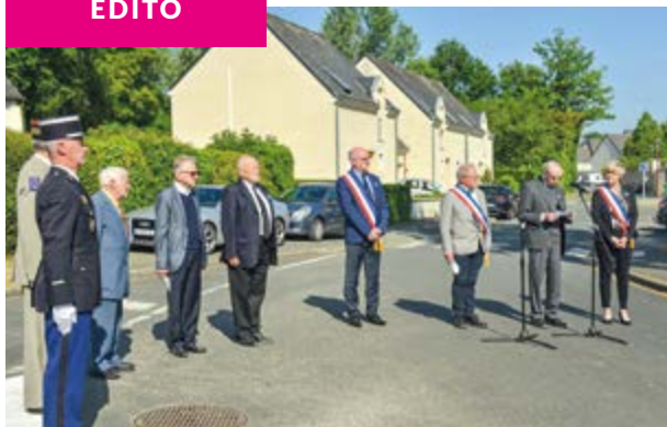
Commemorations du 8 mai à Pellouailles les Vignes en présence du maire et des maires délégués.

Photo de couverture : les visites scolaires se poursuivent au Château à motte et les petits pages sont en formation pour le défendre !