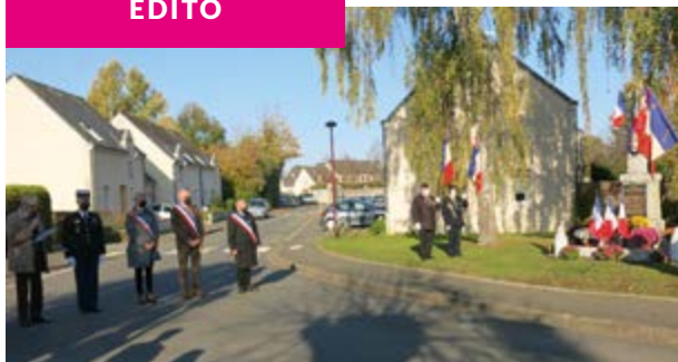
Commérorations du 11 novembre au monument aux morts de Pellouailles les Vignes.