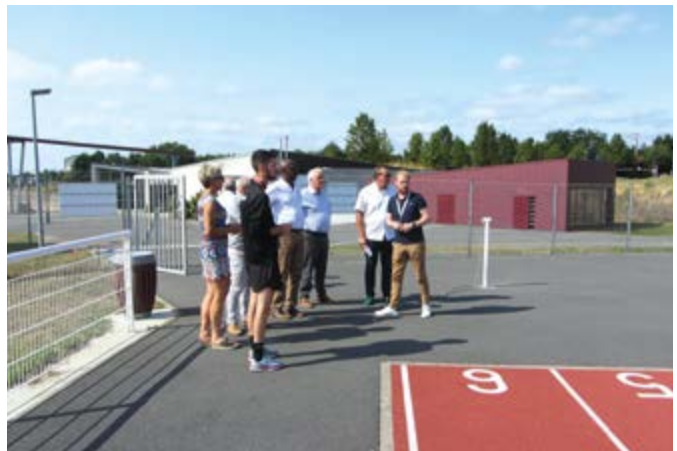
Découverte des infrastructures sportives de la commune.