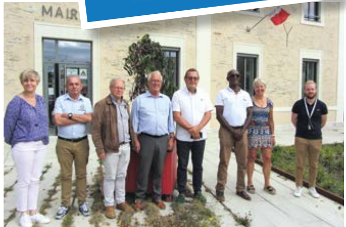
Élus et agents entourent les membres du jury du label Ville sportive des Pays de la Loire.