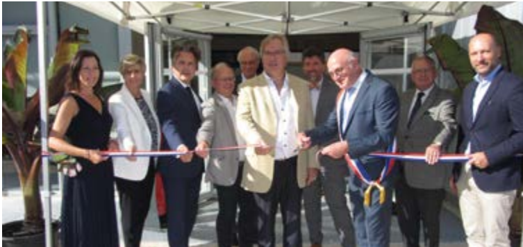
Traditionnel coupé de ruban pour marquer l'inauguration officielle de la troisième salle de sports.

La troisième salle de sport de Verrières-en-Anjou a été inaugurée le 10 septembre dernier après un peu plus d'un an de travaux. Un équipement lumineux, sobre et fonctionnel.