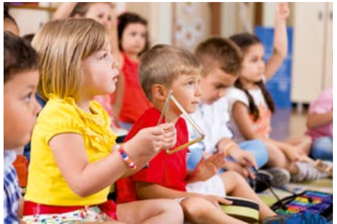
L'accueil des tout petits est au cœur du nouveau projet d'établissement.

Le renouveau du SIAM passe actuellement par l'élaboration d'un nouveau projet d'établissement pour les cinq années à venir. Les questions de l'accueil des tout petits avec l'ouverture de classes d'éveil musical, la proposition d'accompagnement dans les crèches municipales ou MAM (Maisons d'Assistants