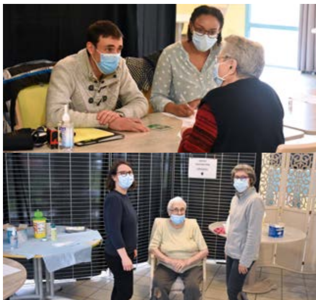
Un médecin, deux infirmières et les aides soignantes de la Résidence ont entouré les volontaires à la vaccination.

Pour partir zen un week-end, ou une à plusieurs semaines, pensez à l'opération tranquillité vacances, service gratuit de sécurisation.