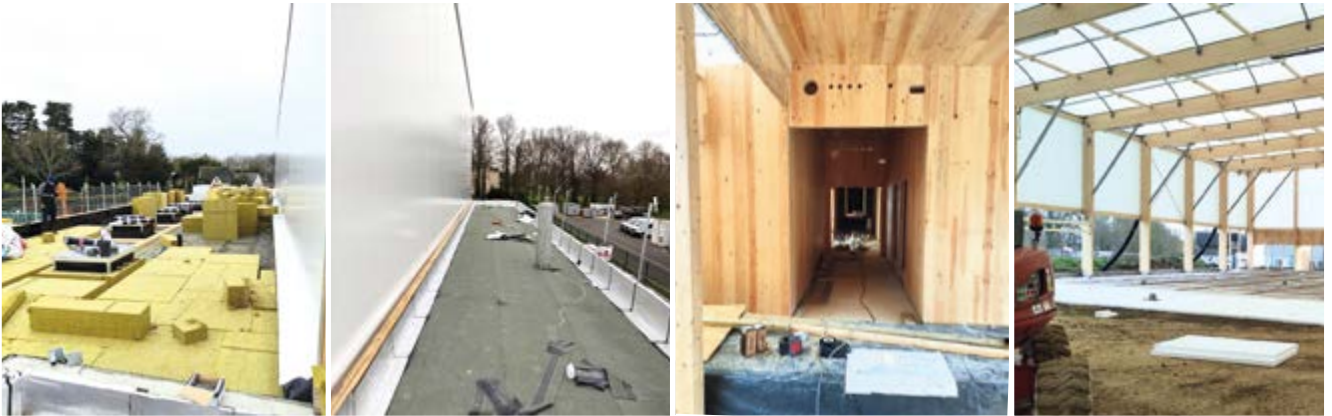
Après la pose de la toile, les travaux se poursuivent, dévoilant, au fur et à mesure, la future structure de l'espace sportif verrois.