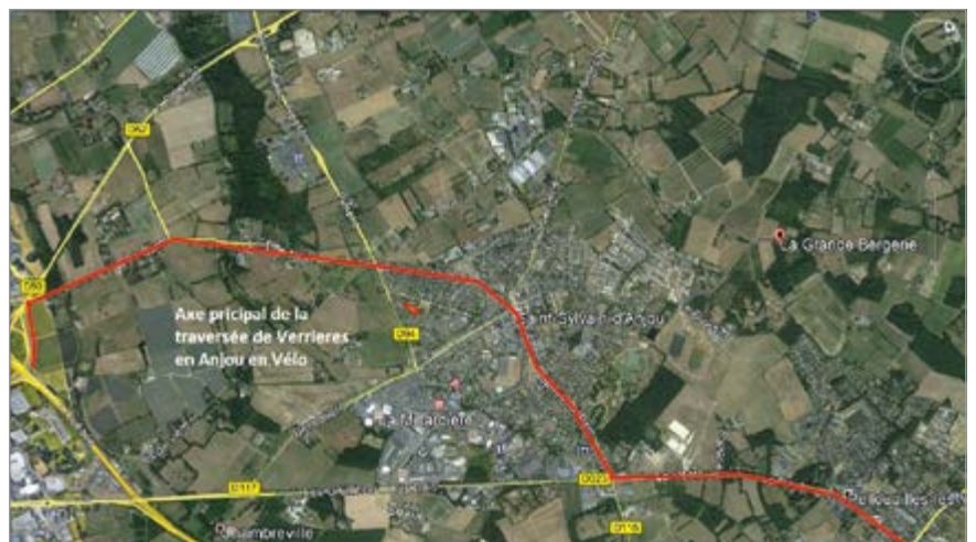
Le tracé en rouge de la future piste cyclable dont les travaux vont bientôt débuter.

Le premier aménagement sera réalisé le mois prochain. Il s'agira d'une voie partagée entre les automobilistes et les cyclistes. Une signalétique directionnelle et un marquage au sol permettront de dissocier les deux parties de la chaussée et d'optimiser la sécurité. Ce premier tronçon reliera Verrières à la zone industrielle d'Écouflant, pour se connecter ensuite aux liaisons d'Angers Loire Métropole. La liaison douce, qui passe entre le bois de la Salle et le complexe sportif, va subir une cure de jeunesse avec le renouvellement de sa surface et le doublement des lampadaires solaires pour renforcer l'éclairage public. Des aménagements nécessaires car cette portion est très fréquentée, notamment par les scolaires. Si le dossier « pistes cyclables » est au cœur des débats depuis quelques années déjà, l'évolution des pratiques, avec notamment l'augmentation des ventes de vélos à assistances électriques, pousse