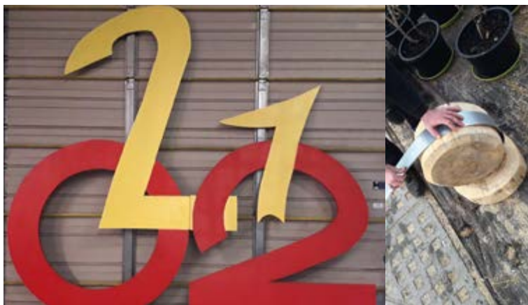
Les vélos seront mis en scène en fonction des lieux où ils seront installés : à vous de les découvrir.