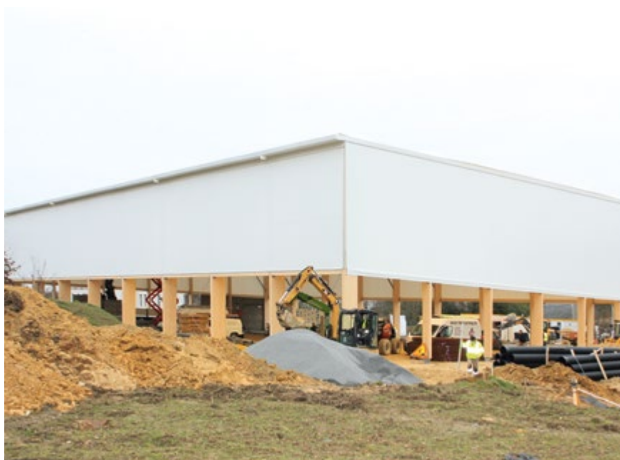
La 3 e salle de sports en cours de construction.