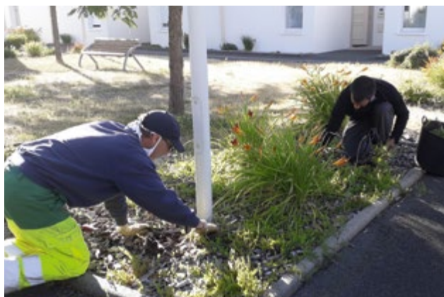
Les agents du service paysage et environnement en action pour embellir la commune.

Avec la Covid 19, le projet fleurissement 2020 n'a pas pu prendre place dans les massifs. C'est donc en 2021 que les vélos vont trouver place au milieu des fleurs et sur les trottoirs. Vous avez toujours possibilité de donner un vieux vélo, ou de vous inscrire pour entretenir un panier fleuri accroché à un vélo qui sera positionné à côté de chez vous, sur le domaine public. Cet été les bicyclettes auront trouvé place dans tous les massifs communaux et vous pourrez en suivre l'évolution grâce au « circuit vélo » qui sera proposé.