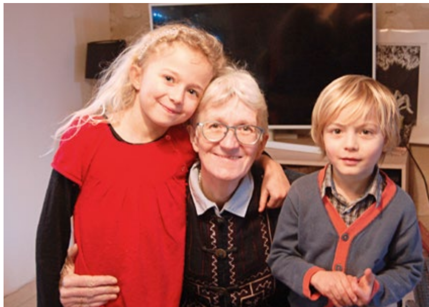
... et avec deux de ses petits-enfants.