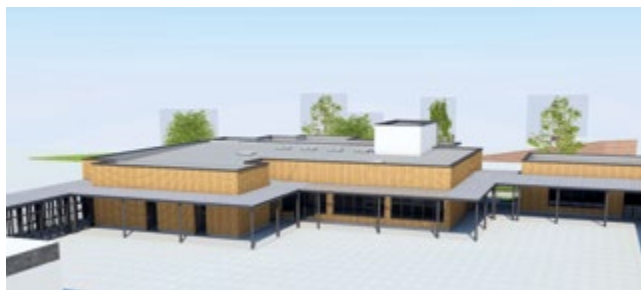
Une projection de l'emplacement des futurs bâtiments du groupe scolaire Jean de la Fontaine.

hand et badminton. L'accueil du public s'y fera dans de bonnes conditions. Les travaux d'extension de la salle des Troubadours sont en cours, ainsi qu'une réflexion sur l'agrandissement de la salle des Joutes.