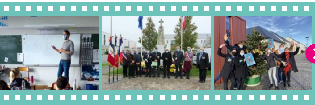
Parcours scolaire en novembre