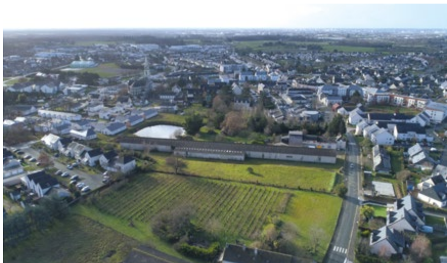
L'emplacement du futur secteur « Anis ».

large et renvoie à la notion de territoire puisqu'elle doit s'étendre aux communes voisines. L'ancien bâtiment C de la résidence adaptée les Blés d'Or va être démolie pour faire place à la construction d'un nouvel immeuble composé de logements en location accessibles à un public senior ou en situation de handicap.