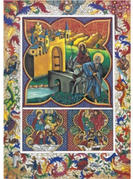
Représentation de Saint Joseph en enluminure.