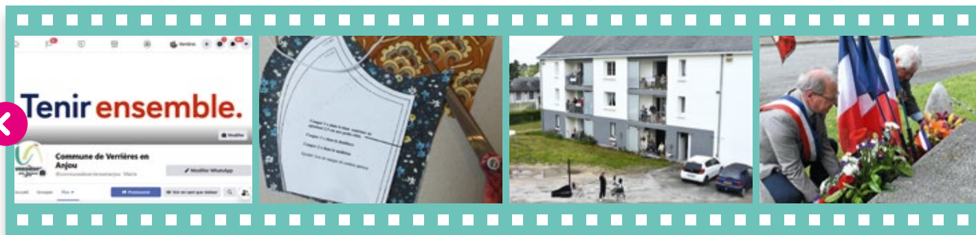
La nouvelle page Facebook de la commune pour une plus grande proximité avec les Verrois.