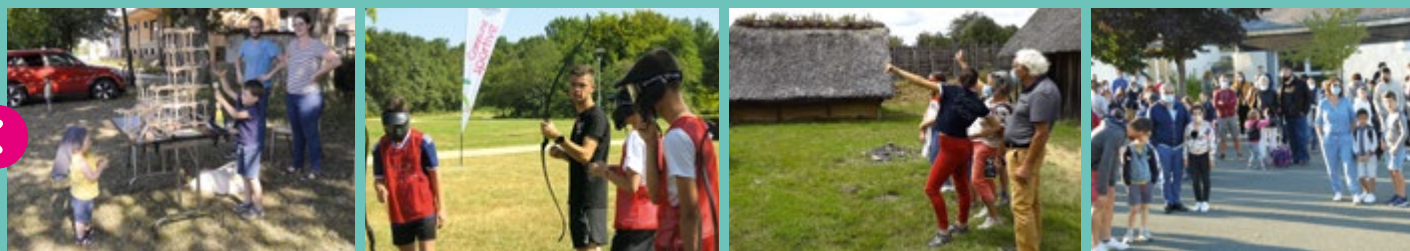
... les animations sportives, l'opération « Verrières en été un jour, un quartier » et la saison au Château en juillet et août.