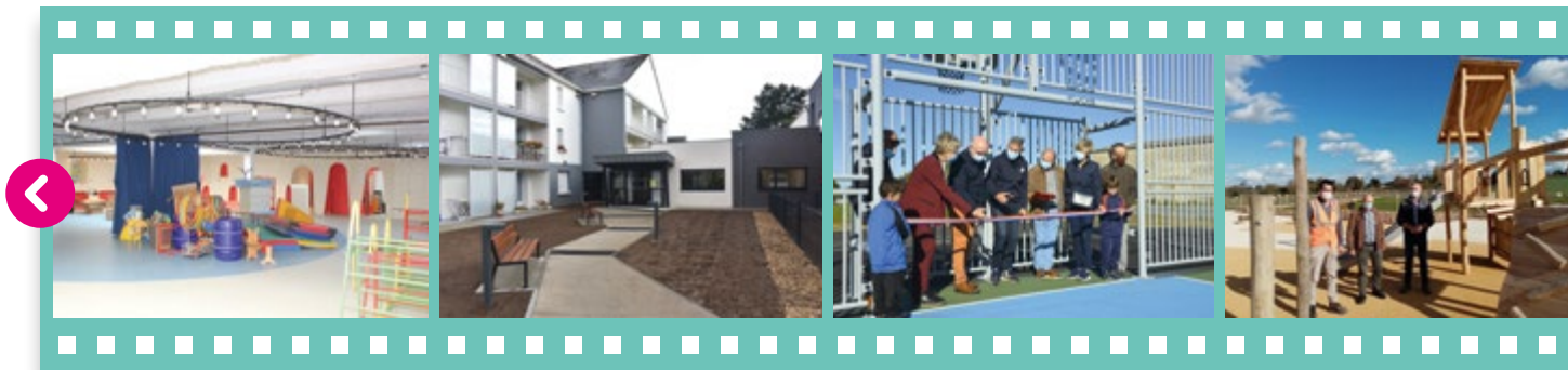
Fin des travaux à l'école du Tertre pendant les vacances d'octobre.