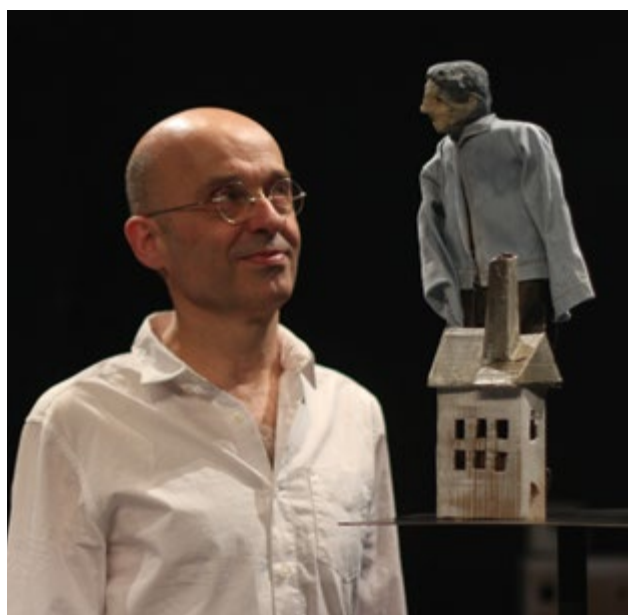
2021 doit voir le spectacle vivant relancé.