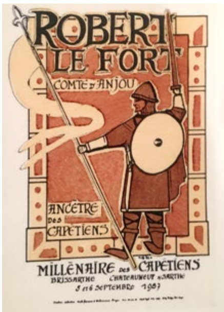
Une enluminure présentant un événement moyenâgeux.