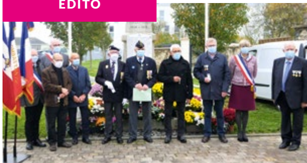
Remise des médailles lors de la commémoration du 11 novembre, en présence du président de la section UNC de Saint Sylvain, du maire et des maires délégués.