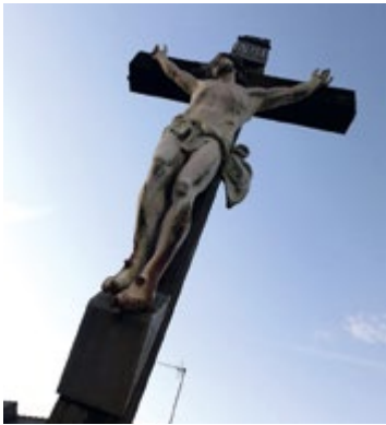
Situé au carrefour de la rue Édouard Chenier et de la rue Pierre Besson, le calvaire fait peau neuve dans les prochaines semaines.