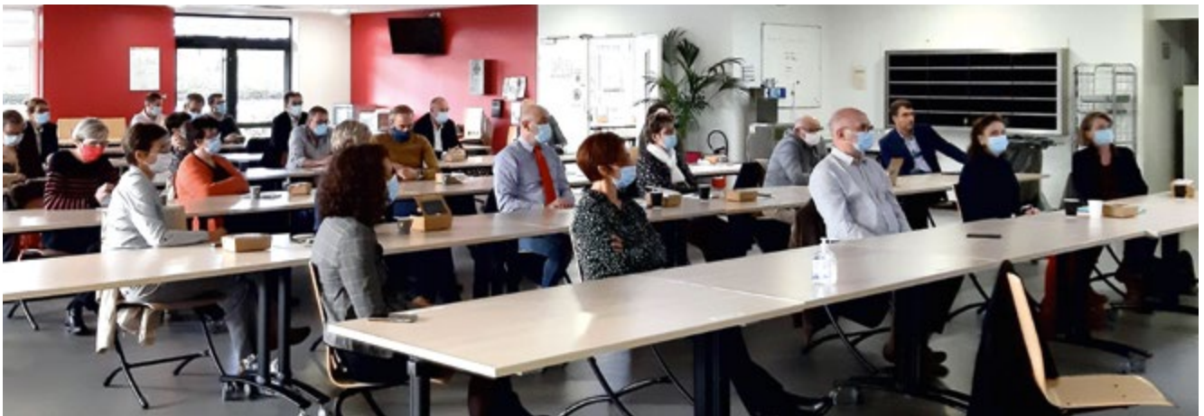
Une matinée d'échanges et de découvertes autour de l'emploi accompagné.

Cette « première », après le confinement et les élections municipales, a fait le plein, mercredi 21 octobre, compte tenu des exigences sanitaires, autour d'un thème d'échanges lié à la « cohésion sociale » ... bien d'actualité dans le contexte économique actuel.