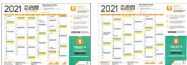
Retrouvez le calendrier 2021 de vos jours de collecte des déchets avec ce numéro.