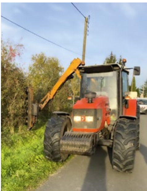
Le lamier en action pour élaguer voiries et chemins communaux.

Débutés le 20 novembre dernier, c'est aux alentours du 20 décembre que les travaux d'élagage aux lamiers doivent s'achever. Il s'agit, pour le prestataire chargé de la coupe et le service voirie chargé de ramasser et de broyer les branchages, d'élaguer les bordures des 70 kilomètres de voiries et de chemins communaux.