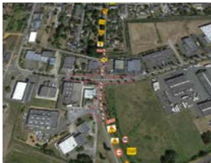
Aménagement et sécurisation de voirie boulevard Louis Delage.