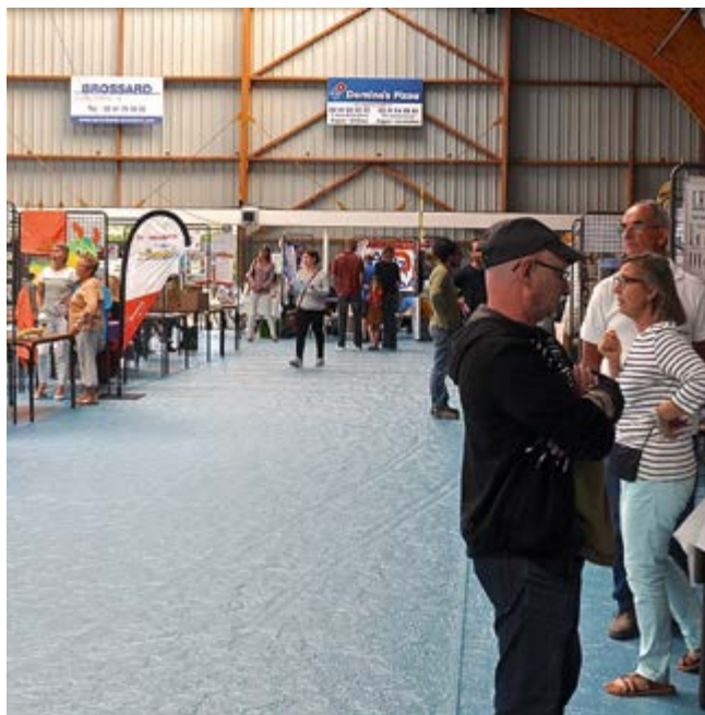
Samedi 5 septembre, venez découvrir la richesse de l'offre associative verroise

Cette journée se déroulera dans le respect des consignes sanitaires. Le port du masque sera obligatoire, du gel hydroalcoolique sera à votre disposition et un sens de circulation sera mis en place. Et, si les conditions sanitaires se dégradent, la municipalité se réserve le droit de modifier, voire d'annuler le déroulement de cette manifestation.