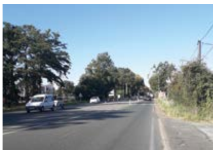
Les travaux vont débuter sur la RD 323 au niveau du lieu-dit de la Singerie.

Sur la commune déléguée de Pellouailles, les travaux d'aménagement et de sécurisation de voirie vont débuter, lundi 24 août, au niveau du boulevard Louis Delage et du carrefour avec la ZAC Océane. Des passages piétons et deux stops vont être créés, ce qui modifiera le sens de priorité de ce croisement. Ces travaux, d'une durée d'environ un mois, nécessiteront des restrictions de circulation évolutives en fonction de l'avancée du chantier. Une circulation alternée sera mise en place :