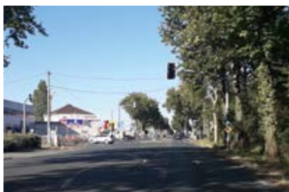
De nouveaux feux tricolores vont être installés sur la RD 323, au niveau de la rue Hélène Boucher.