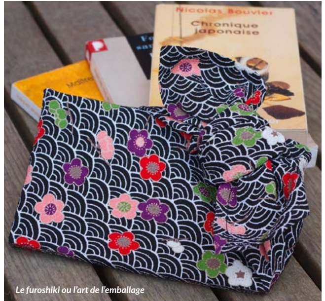
Le furoshiki ou l'art de l'emballage